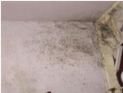
Bild 2: Schimmelformung an Wänden und Decke durch schlechte thermische Isolation.

Die Verbesserung der Energieeffizienz bringt mehr als nur Kosteneinsparungen. Eine gut ausgeführte thermische Verbesserung Ihres Gebäudes bringt Ihnen zusätzlich ein behagliches und zugluftfreies Wohnklima. Die Bildung von Kondensation an Wänden und Fenstern und daraus resultierendem Schimmel wird vermieden.