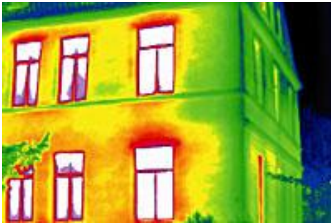
Bild 1: Wärmebildaufnahme eines Gebäudes. Rote Bereiche deuten auf hohen Wärmeverlust hin.

Die Qualität der thermischen Isolation Ihres Gebäudes kann mithilfe von Wärmebildaufnahmen anschaulich dargestellt werden. Wir nutzen diese Methode routinemäßig, um die Bereiche zu finden, die am meisten zu Ihren Energiekosten beitragen. Die Verbesserung dieser kritischen Bereiche ergibt das beste Verhältnis von Kosten und Nutzen.