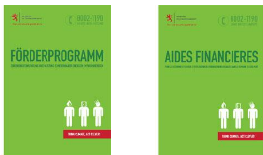
Bild 8: Broschüren des Umweltministeriums zu staatlichen Beihilfen.

Bei diesen Förderprogrammen sind Änderungen vorbehalten und der jeweils gültige Stand kann im Internet über www.eco.public.lu abgefragt werden.